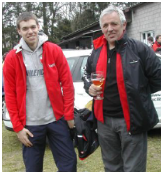
Vader en zoon Goossens konden niet weerstaan aan de new look van Hamok