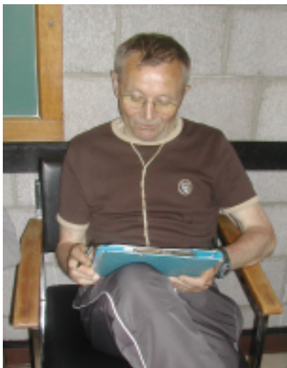
De secretaris schikt zijn documenten