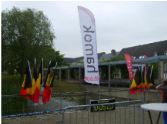
Mooie aankomstesplanade met 'klein reliëf'

reilde en zeilde zoals hij het in zijn intiemste scheppingsmomenten bedacht had. Ook de bezoekende clubs moeten het sprintevenement hebben geapprecieerd want werd er niet gesproken over latten die altijd maar hoger werden gelegd? En iedereen weet dat wij Aarschot, Sankt Vith en Marche-en-Famenne in alle toonaarden hebben bezongen.