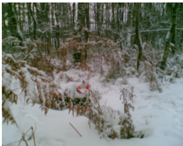
Zoek het postje

Het zou de cross der crossen worden, de laatste hamokcross van het jaar 2009 p.c.n.. Met de Timmers touch als leidraad een oriëntatiefeest. Helaas beslisten de weergoden er anders over. 's Zaterdags pootte Guido Timmers en de zijnen nog met een drillboor de posten in de steenhard bevroren grond ... die dan zondagmorgen met gulle weergodenhand met sneeuw werden toegedekt.