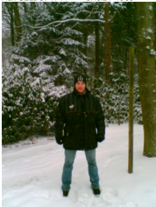
De gedupeerde baanlegger geniet van zijn decor