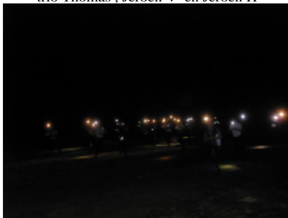
De start van de MSBN waarvan slechts weinigen genoten hebben in tegenstelling met