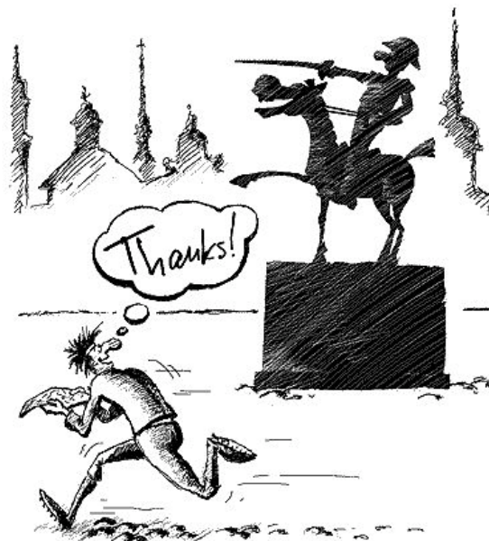
The author: Yuriy MANAEV (RUS)