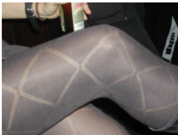
Dit Nieuw speelveld voor spelletje OXO?